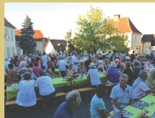
Jazz au fronton

LEMBEYE-GARLIN – Place Marcadieu, 64350 Lembeye Tél. 05 59 68 28 78 – Point d'accueil estival, 3, rue Firmin Bacarisse, 64330 Garlin @ : contact@tourisme-vicbilh.fr Site : www.tourisme-vicbilh.fr